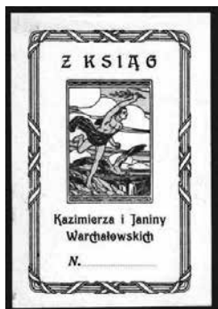
Fot. 2.