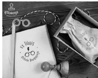
Fot. 5.

Mały symbol w różny sposób identyfikujący książkę (naklejka, stempel i tym podobne) niejednokrotnie bywa dziełem sztuki samym w sobie, podnosząc wartość kolekcjonerską egzemplarza. Ujawnia tożsamość właściciela – jego zainteresowania i wrażliwość na sztukę – styl epoki czy artyzm wykonawcy. Dostarcza wielu interesujących informacji zawartych w symbolicznej grafice. Wpisuje się także w tematykę pamięci pokoleń, które utrwały swoją obecność przez rękopiśmienne wpisy, odręczne dedykacje czy laudacje.