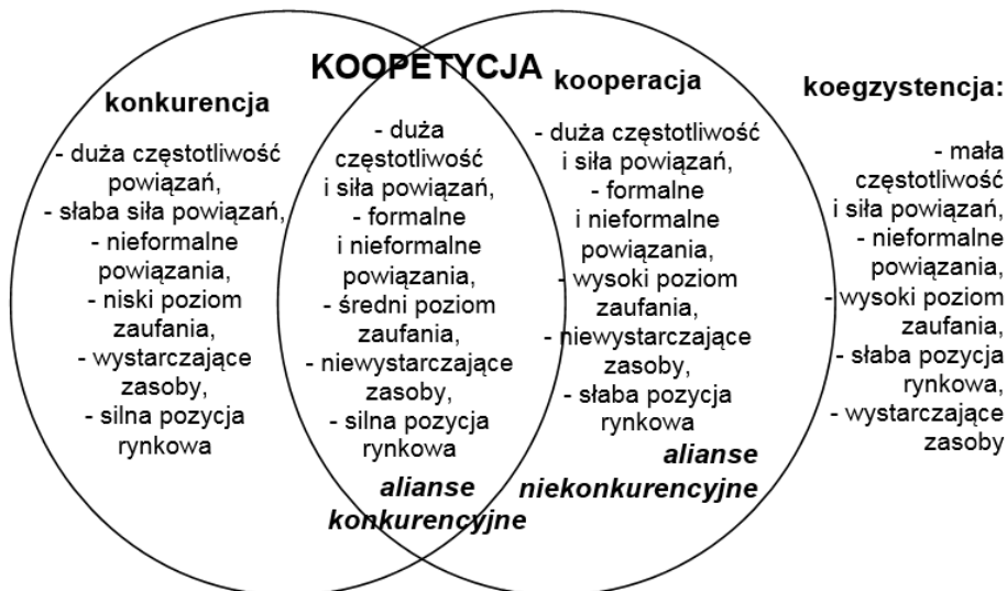
Rys. 1. Kooperacja przedsiębiorstw na tle rywalizacji i współpracy

Reasumując, współpraca międzyorganizacyjna to jedna, obok konkurencji i koegzystencji, z opcji rozwojowych przedsiębiorstwa, zwłaszcza w warunkach gospodarki opartej na wiedzy. Zazwyczaj związana jest ona z funkcjonowaniem w różnorodnych sojuszach, utożsamianych z aliansami. W zależności od przyjętej perspektywy aliansy mogą mieć charakter konkurencyjny lub niekonkurencyjny. W przypadku wąskiego podejścia do definiowania koalicji – konkurencja i współpraca mają charakter rozłączny. Natomiast w sytuacji szerokiego traktowania partnerstwa aliansy konkurencyjne wpisują się w wyłonioną z końcem XX wieku koncepcję kooperacji lub kooperacji przedsiębiorstw (rys. 1).